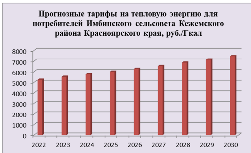
Рисунок 15.1.1. Прогнозные тарифы на тепловую энергию для Имбинского сельсовета