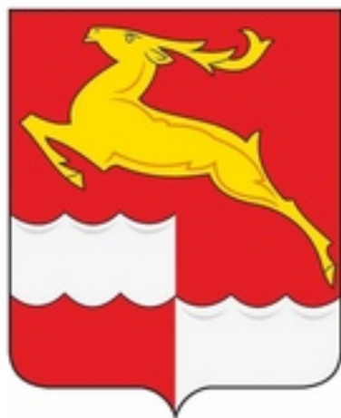
СХЕМА ТЕПЛОСНАБЖЕНИЯ ИМБИНСКОГО СЕЛЬСОВЕТА КЕЖЕМСКОГО МУНИЦИПАЛЬНОГО РАЙОНА КРАСНОЯРСКОГО КРАЯ НА 2023 ГОД И НА ПЕРИОД ДО 2030 ГОДА

УТВЕРЖДЕНО Постановлением Администрации Кежемского района Красноярского края от 21.12.2022 № 957-п