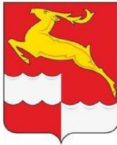
СХЕМА ТЕПЛОСНАБЖЕНИЯ ЗАЛЕДЕЕВСКОГО СЕЛЬСОВЕТА КЕЖЕМСКОГО МУНИЦИПАЛЬНОГО РАЙОНА КРАСНОЯРСКОГО КРАЯ НА 2024 ГОД И НА ПЕРИОД ДО 2030 ГОДА

УТВЕРЖДЕНО Постановлением Администрации Кежемского района Красноярского края от 26.09.2023 № 758-п