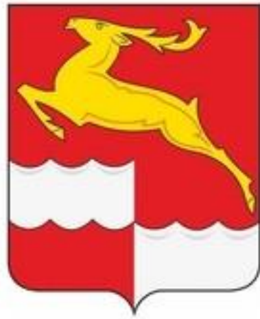
СХЕМА ТЕПЛОСНАБЖЕНИЯ ИМБИНСКОГО СЕЛЬСОВЕТА КЕЖЕМСКОГО МУНИЦИПАЛЬНОГО РАЙОНА КРАСНОЯРСКОГО КРАЯ НА 2024 ГОД И НА ПЕРИОД ДО 2030 ГОДА

УТВЕРЖДЕНО Постановлением Администрации Кежемского района Красноярского края от 26.09.2023 № 757-п