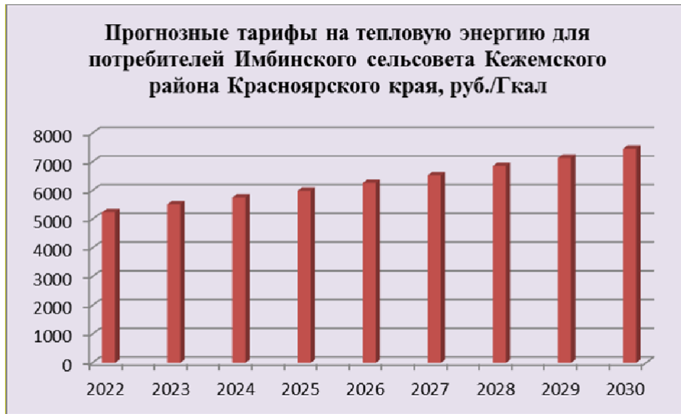
Рисунок 15.1.1. Прогнозные тарифы на тепловую энергию для Имбинского сельсовета