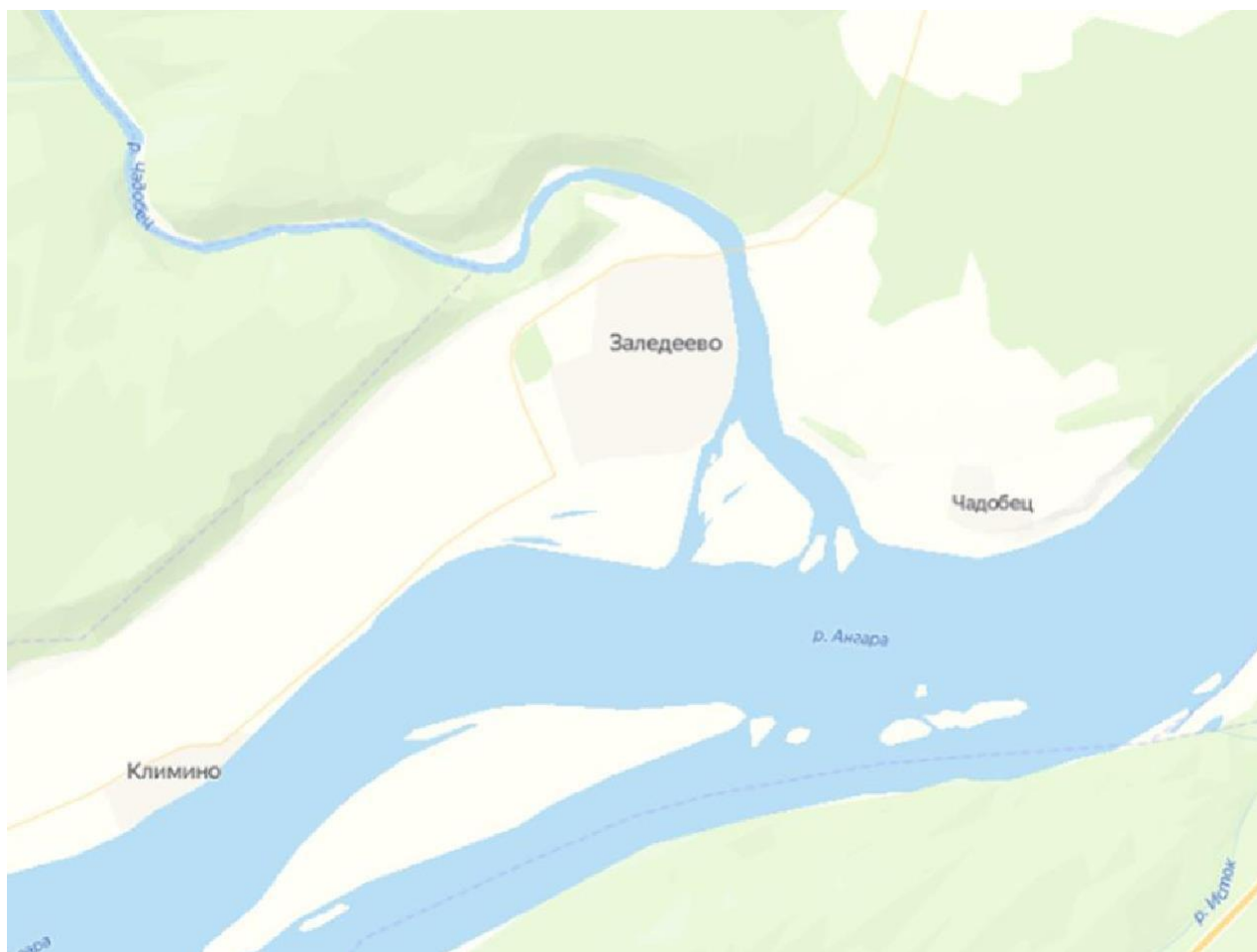
Рисунок 1. Карта границ Заледеевского сельсовета Кежемского района