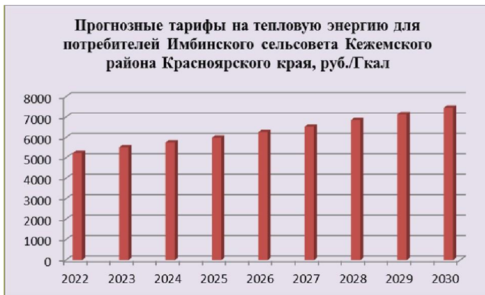
Рисунок 2. Прогнозные тарифы на тепловую энергию для Имбинского сельсовета